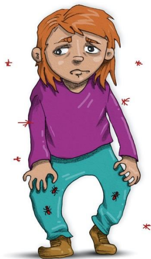
MYROR I BENEN