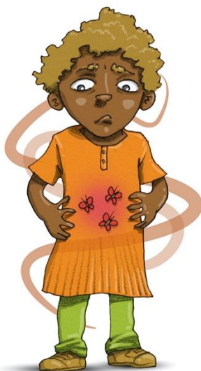
FJÄRILAR I MAGEN