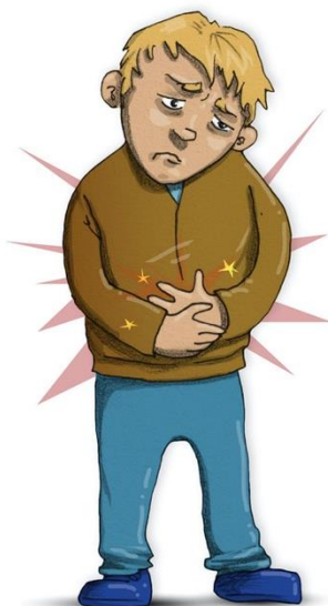
ONT I MAGEN

Hur brukar ångest kännas för dig? Ringa gärna in om någon bild stämmer på dig!