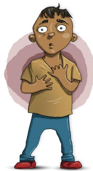
SVÅRT ATT ANDAS

Ångest kan också påverka dina tankar. Den kan göra så att du tänker på jobbiga saker, ofta sådant som du är rädd för ska hända. Det kan till exempel vara att det ska hända dig eller någon annan något hemskt, att saker kommer gå dåligt eller att det ska dyka upp något farligt.