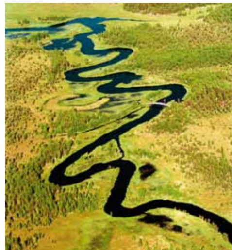
Nittälven slingrar sig fram genom norra delen av Örebro län.